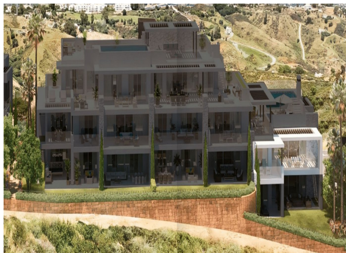
BLOCK 5 Apartment 5.1.1 TYPE B