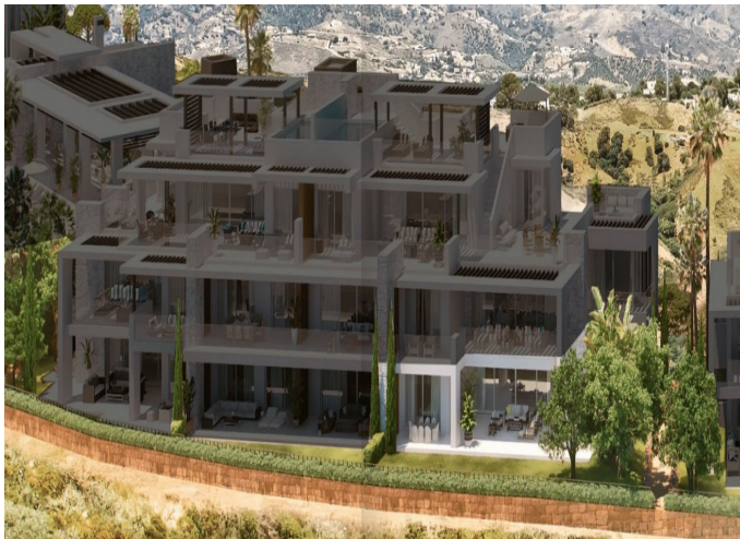
BLOCK 4 Apartment 4.0.1 TYPE C

3 Dormitorios | 3 Baños | 275 m 2 Interior | 110 m 2 Terrazas | Garaje Si | Piscina Si |