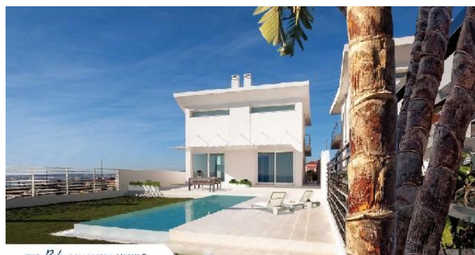
THE Palen COLLECTION Modelo F

4 Dormitorios | 3 Baños | 320 m 2 Interior | 278 m 2 Terrazas | Garaje Si |