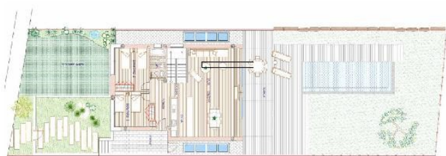
THE Palen COLLECTION Modelo F

Superficie Construida Cerrada 320,45 m 2 Superficie Construida Abierta 278,45 m 2 Superficie Parcela 912 m 2 Superficie Parcela 912 m 2