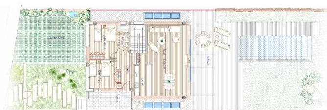
THE Palen COLLECTION Modelo L

Superficie Construida Cerrada 320,45 m 2 Superficie Construida Abierta 278,45 m 2 Superficie Parcela 912 m 2 Superficie Parcela 912 m 2