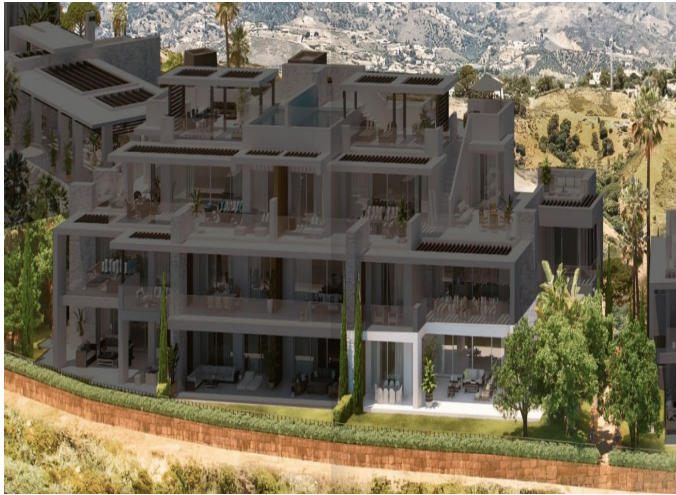
BLOCK 4 Apartment 4.0.1 TYPE C

3 Dormitorios | 3 Baños | 275 m 2 Interior | 110 m 2 Terrazas | Garaje Si | Piscina Si |