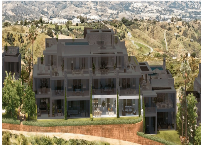
BLOCK 5 - FIRST FLOOR