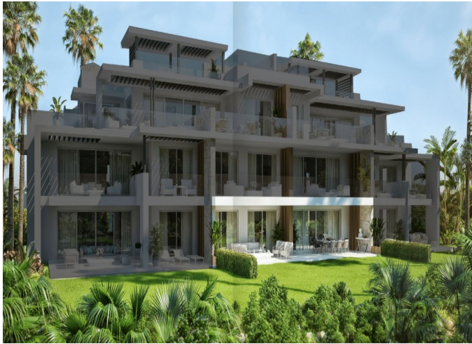
BLOCK 3 Apartment 3.0.2 TYPE A2

2 Dormitorios | 2 Baños | 203 m 2 Interior | 71 m 2 Terrazas | Garaje Si | Piscina Si |